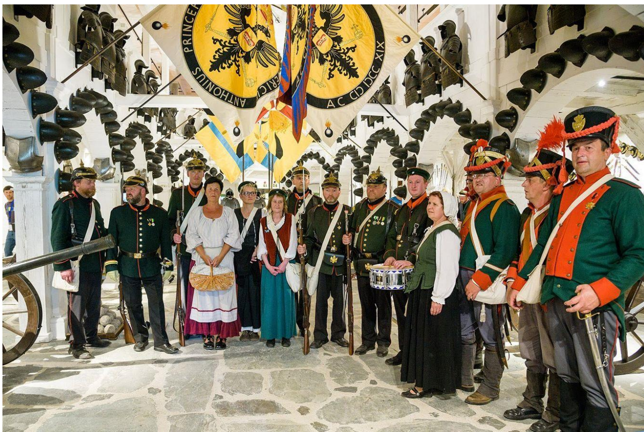
Eröffnung Zeughaus in Schwarzburg