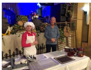
Volker & Schokodame