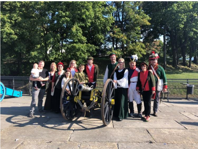
Kanonendonner auf Festung Königstein