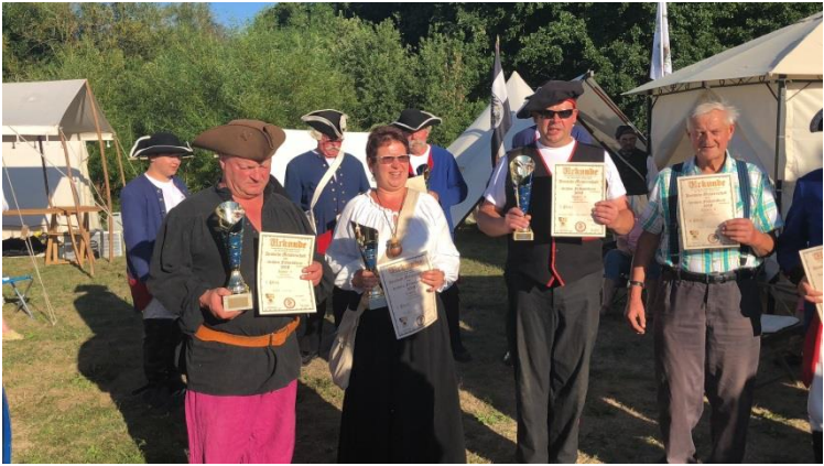
DM Feldartillerie Ueckermünde