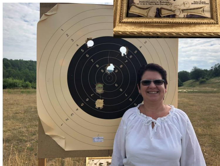
EM Feldartillerie in Sondershausen