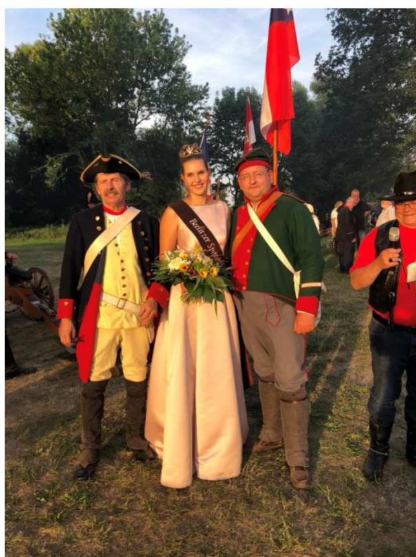
Mit Spargelkönigin in Beelitz