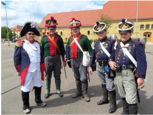
Leipzig zu Gast bei der Bundeswehr