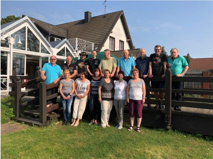
Feuerwerkerlehrgang am Mellensee