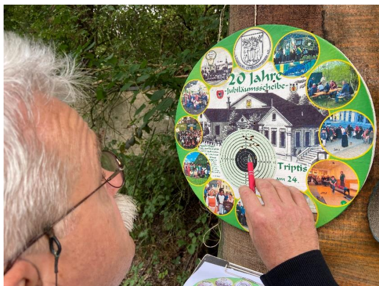
Königsschießen & Ehrenscheibe