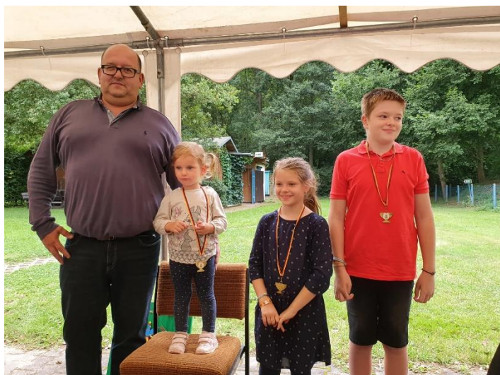
Ehrung der Jungen & Neuen