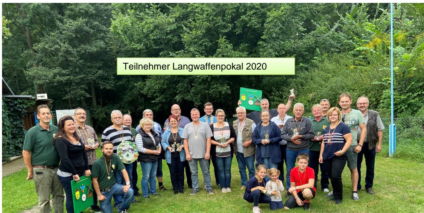
Teilnehmer Langwaffenpokal 2020