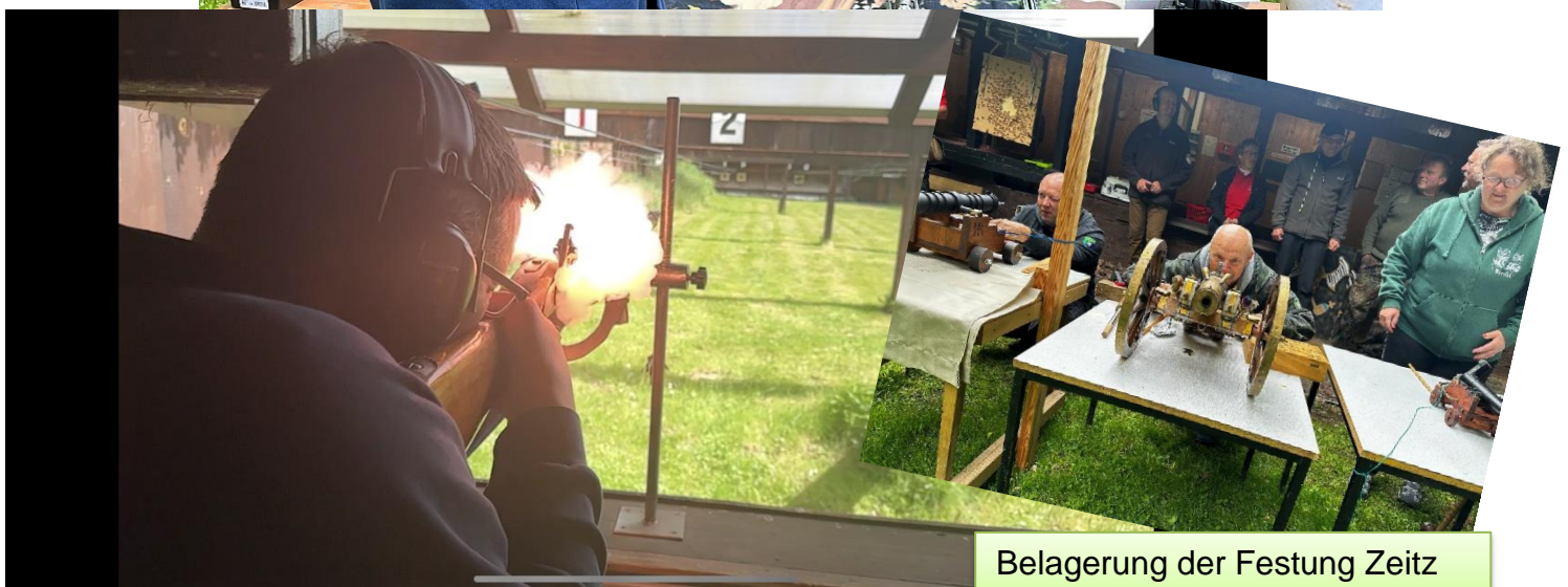
Belagerung der Festung Zeitz