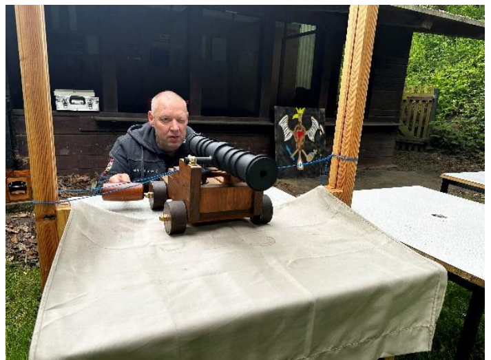
Modellkanonen-Schießen in Zeitz

Empf.: 1. Triptiser SV IBAN: DE03 8305 0505 0000 0774 29