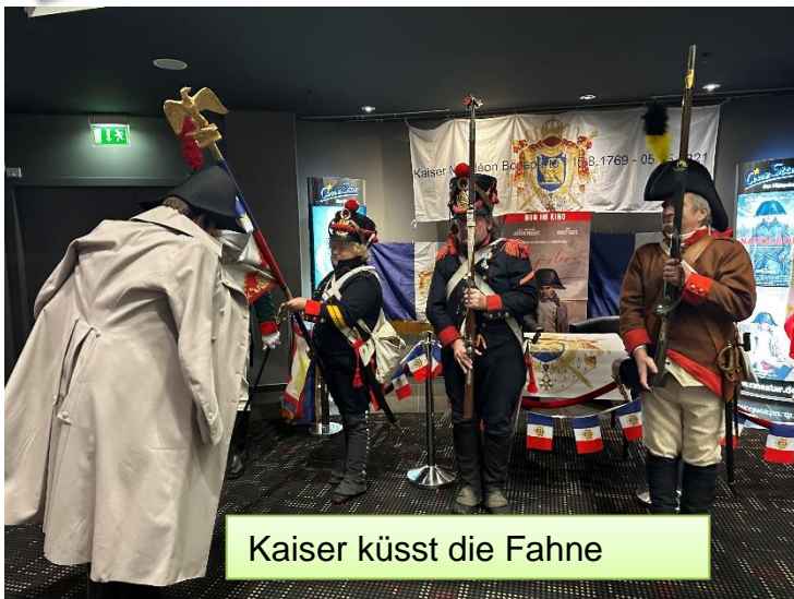
Kaiser küsst die Fahne